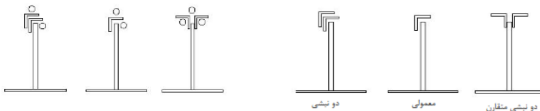
ب- نبشی و میلگرد

یادآوری - نمونه‌هایی از تیرچه‌های با جان باز متداول جهت آگاهی در شکل ۳ نشان داده شده است.